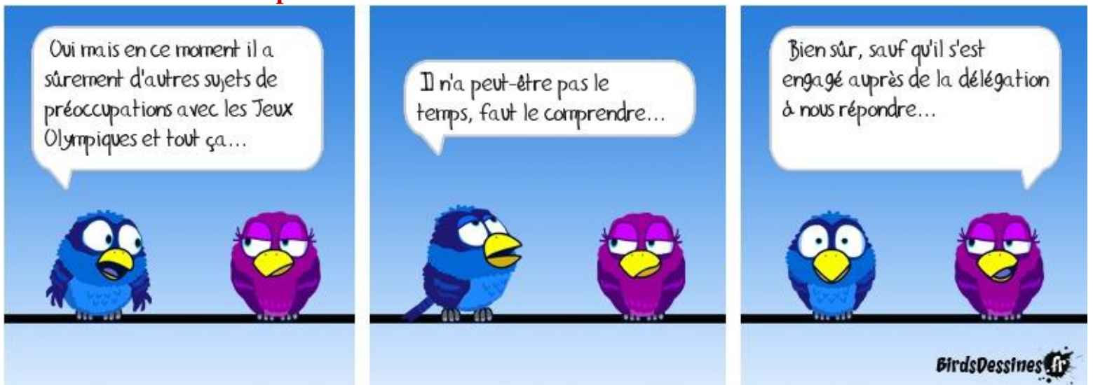
Illustration de la période de juillet 2024 :