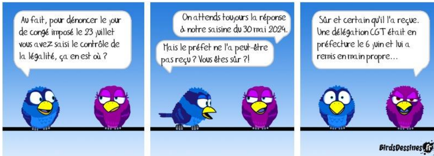
Illustration de la période de Juin 2024 :